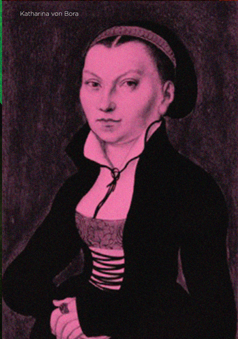
Katharina von Bora